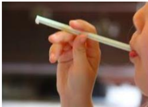
image source: http://chasingcheerios.blogspot.com/2011/07/blow-gun-game.html

Identify the previous grammatical structures used in the last trimester through a vocabulary straw game.